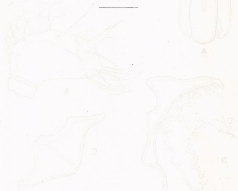
Fig. 1. Larva of Leptocryptus sp. n. A. Dorsal view. B. Lateral view. C. Detail of leg. D. Detail of leg. Scale bar = 0.5 mm.

Fundort: Australien, Victoria, Moleside Creek, Glenelg River, 23.3.1951 (H. G. Chittleborough leg.). Typus im South Australian Museum, Adelaide.